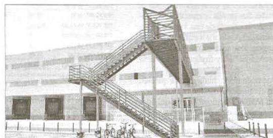
La plataforma expedirá 52 millones de artículos al año.

La plataforma es el primer centro continental de la compañía