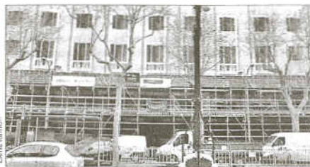
Barcelona abrirá diez nuevos hoteles de cinco estrellas hasta 2010.

Barcelona, por Albert Alsina, director del fondo. Pág.3