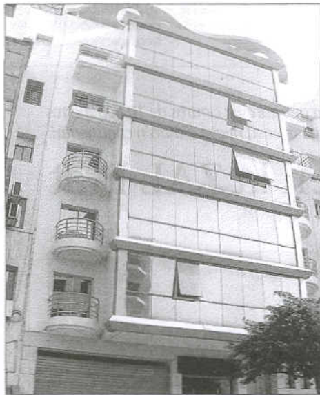
Edificio que alberga la oficina de Riva y García en Casablanca.

La apertura de las delegaciones llega después de que Riva y García se adjudicara en concurso, el pasado año, la gestión del fondo de capi-