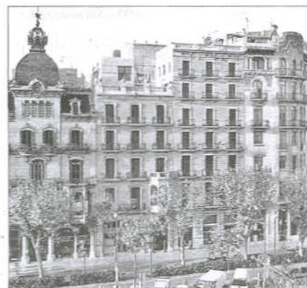
Zegna y Hotusa son los otros inquilinos del inmueble.