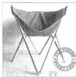
La silla se vende en Vinçon

La firma de moda y complementos infantiles Bobo Chosés, con sede en Mataró, ha lanzado una silla en edición especial para la tienda Vinçon realizada de tela y madera. Además, la marca infantil acaba de poner en funcionamiento su tienda online, con ropa para niños de entre 0 y 9 años. / Redacción