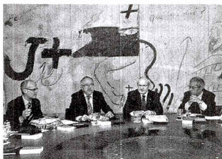
El Consell Executiu se reunió ayer en la Generalitat.

bierno, aunque puso como línea roja lo estipulado en el Estatut. El texto indica que las inversiones del Estado en Catalunya deben ser equivalentes al peso del PIB catalán en el Estado, el 18,8% del total. El Govern expuso, además, que no piensa recortar los capítulos del gasto social, la sanidad y la educación. Zapatero convocará a los representantes autonómicos a una reunión del Consejo de Política Fiscal y Financiera para repartir responsabilidades en su plan de ajuste. El presidente desglosará hoy detallar ya en el Congreso de los Diputados los detalles del proyecto. P7