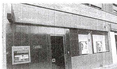
Una de las oficinas del banco.