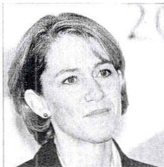
Barbara Cassani, presidenta de Vueling, aerolínea que cuenta con 17 rutas desde Barcelona

En los nueve primeros meses del año Vueling y Clickair sumaron un total de 4,57 millones de pasajeros transportados en el Aeropuerto del Prat. Esta cantidad les otorga conjuntamente una cuota de mercado del 18,19%. Vueling, compañía participada entre otros por el grupo Planeta, transportó a 2,31 millones de personas. Clickair, impulsada por Iberia y que inició sus operaciones en octubre de 2006, movió a 2,26 millones. En Clickair consideran que ya superarán a Iberia en las cifras de pasajeros de este mes de noviembre.