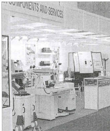
'Stand' de la empresa en la feria BIEMH en Bilbao en 2006.