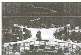
Inversors a la sala de contractacions de la Borsa de Frankfurt

■ Els esforços de Zapatero per demostrar la solvència espanyola van rebre ahir una petita ajuda per part del govern nord-americà. L'ambaixador dels EUA davant la UE, William E.